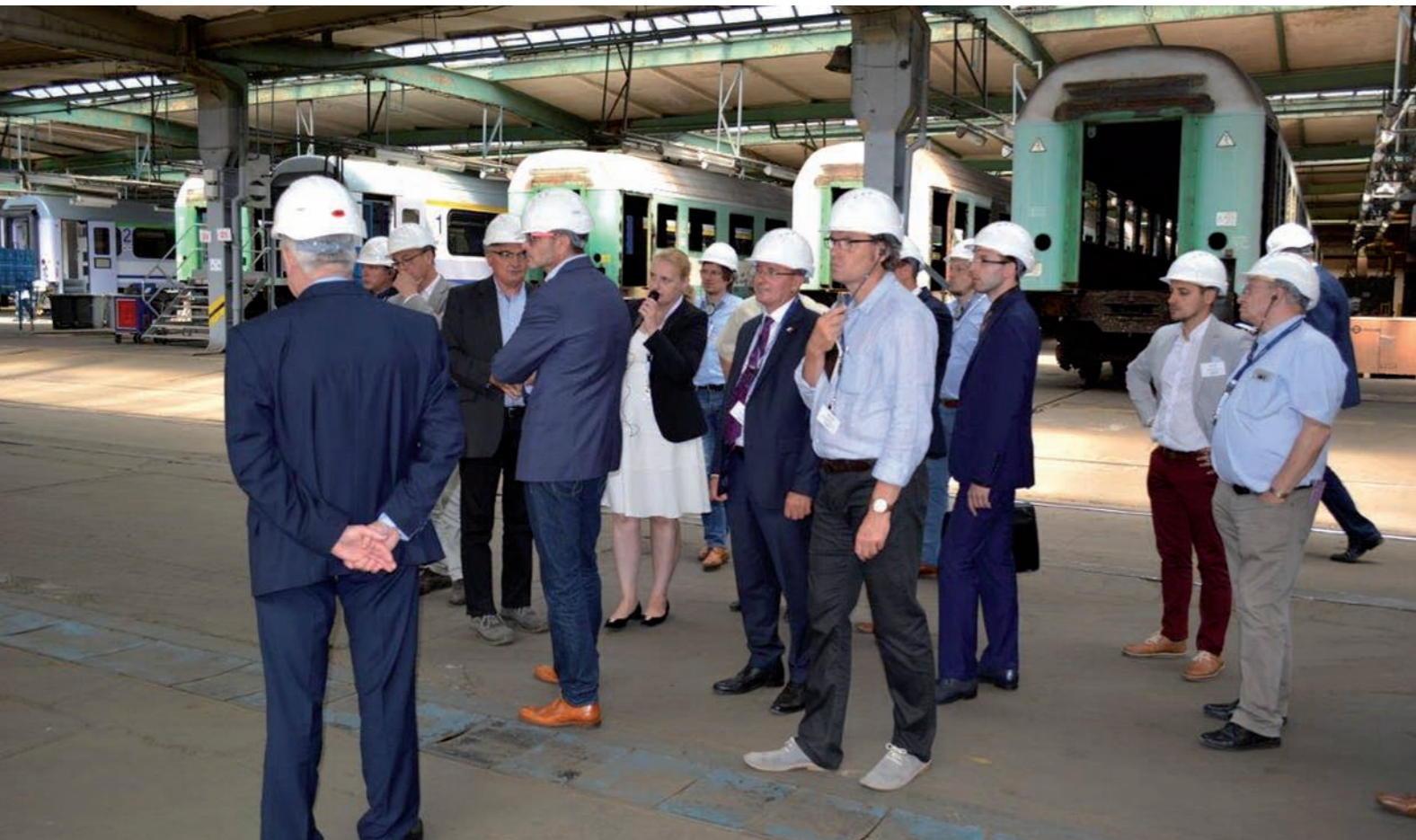
Umsehen beim Netzwerkpartner H. Cegielski – FPS Sp. z o.o.