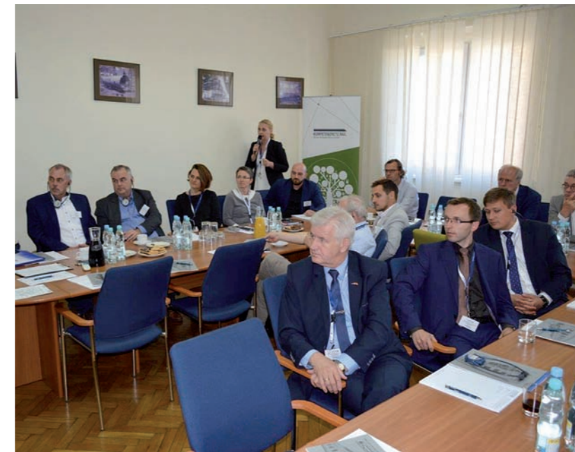
Neben dem Gedankenaustausch blieb genügend Zeit, um neue Kontakte zu knüpfen.

aus Berlin, resümiert: „Es ist schon etwas Besonderes, sich vor Ort bei einem polnischen Hersteller umzusehen und dabei mit den polnischen Experten ins Gespräch zu kommen. Und Networking hat immer mit persönlichen Kontakten zu tun, ganz unabhängig von der Nation. Einen Dank an KNRBB und FPS, die uns das ermöglichen haben. Jetzt liegt es an uns, etwas daraus zu machen.“